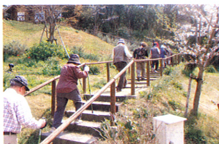
▲ノルディックウォークをする利用者の方々

2本のストックを持って自然の中を歩く「ノルディックウォーク」は、年齢性別を問わずに気軽に楽しめるだけでなく、リフレッシュしながら無理なく全身運動が行えるおすすめのスポーツです。